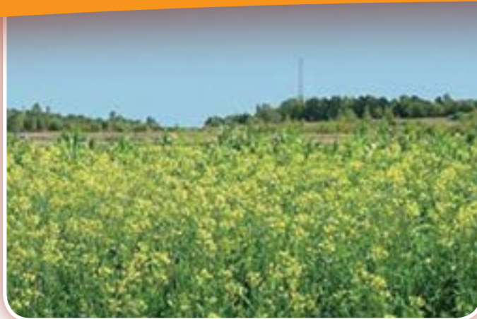
Culture du maïs et du canola sur l'ancien parc de résidus miniers de Copper Cliff, près de Sudbury, en Ontario

est dirigée par Ressources naturelles Canada ( www.rncan.gc.ca/mineraux-metaux/technologie/4474 ), et qui vise à améliorer la performance environnementale du secteur minier et à créer des occasions en matière de technologies écologiques.