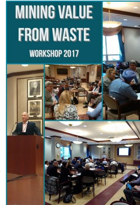
Traduction: Valorisation des résidus miniers, atelier 2017